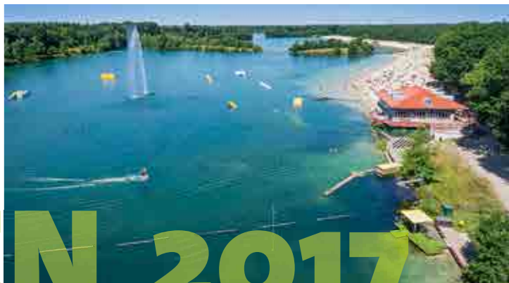
© Schloss Dankern GmbH & Co. KG

bere Luft, Wälder und Wiesen. Schöne Ferienhäuser sind eure Quartiere, in denen Ihr in wechselnden Teams eure Mahlzeiten selbst zubereitet.